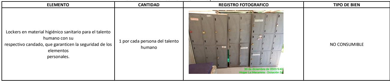
Tabla 24. Relación de Elemento Mínimo para el Área de Alistamiento